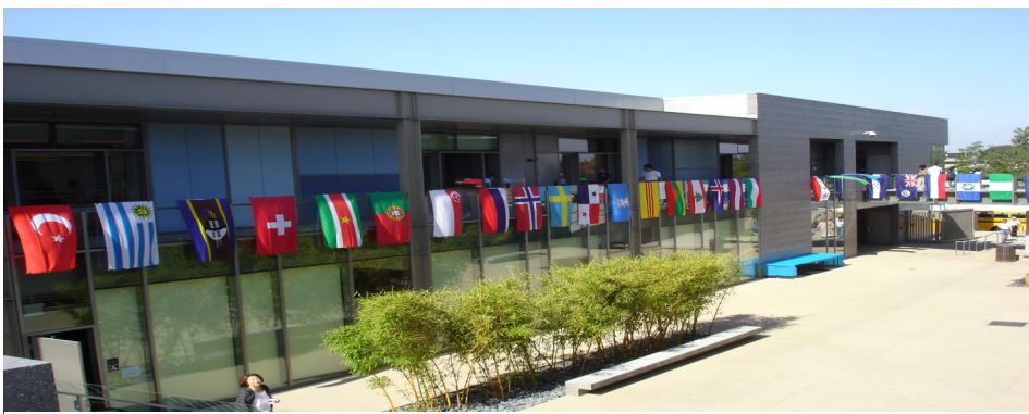
English as a Second Language Institute (ESL)设在加州西敏市 (Westminster, CA.) 的 Le-Jao Learning Center。

供了一系列协助。Coastline 社区大学的教师，辅导员和导师都非常欢迎EBUS的学生，很高兴能帮助学生成功地完成他们的大学课程。